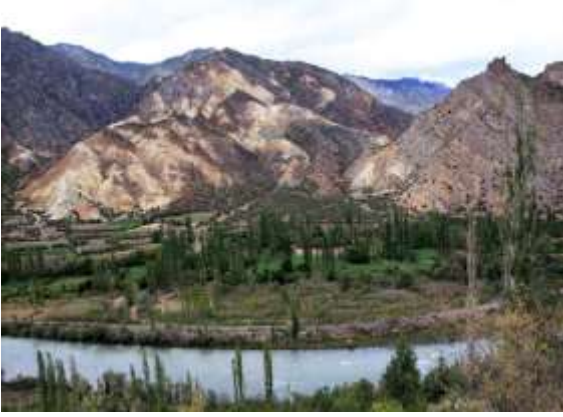
Fotoğraf 7: Artvin'de Ormanların Koruyucu Hizmetlerine Muhtaç Topraklar ve Sular

küresel iklimi düzenleme, .. vb. hizmetler için yararlanıcılar ile bu hizmetleri üretenler arasında bir ilişki sıkıntısı olduğu gerçektir.