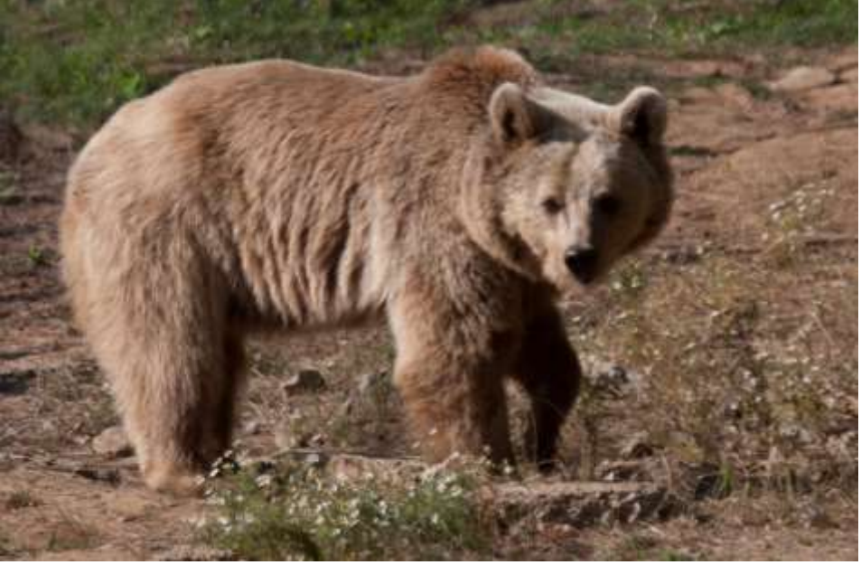
Fotoğraf 16: Birlikte yaşamayı öğrenmemiz gereken bir Ayı, Foto: Aykut İnce

Sürekli kırdan yaşayan insanımızın yaban hayatından yakınmaları büyüktür. Köylü, arıcılık yapıp geçimini sağlamak ister ama ayı gelip kovanlarını yıkar. Vatandaş meyve yetiştirip evine bakmak ister ama ayı daha önce gelip meyvesini yediği yetmemiş gibi ağaca da zarar verir! İnsanlar bu hayvanları avlayıp öldürmek istiyor fakat devletin kuralları ile karşılaşılıyor ve devlet ayıyı bizden çok koruyor diyor! Ayının hakkı var, insan olarak bizim yok diye yakınıyorlar! Bu hayvanların varlık değerlerinden, seçenek ve miras değerlerinden bahsedecek olduğunuzda öfkeyle “ya bizim değerimiz” diyorlar. Haksızlar mı?