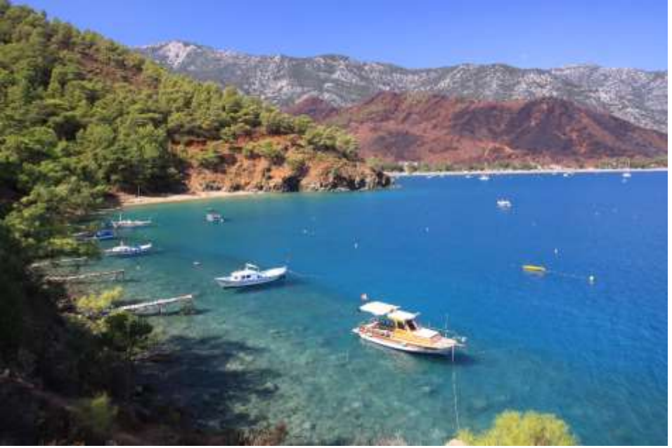
Fotoğraf 1: Antalya Adrasan'da Yanmış Bir Orman Alanı

Kamuoyunun tepkileri yerden göğe kadar haklıdır. Orman yangını ilgiyle izlenmesi gereken bir sorundur. Tıpkı bir savaş gibidir. İnsanı diyenin gözüne, kulağına, burnuna, dokunma duyularına, varsa vicdanına etki ederek, kendini gösterir. Ama yangın ormancının mert düşmanıdır. Her şeyiyle ortadadır. Yıldırımından, volkanlardan, göktaşlarından kaynaklanan yangınlar, ekosistemin bir parçası olarak, kabul bile görebilir.