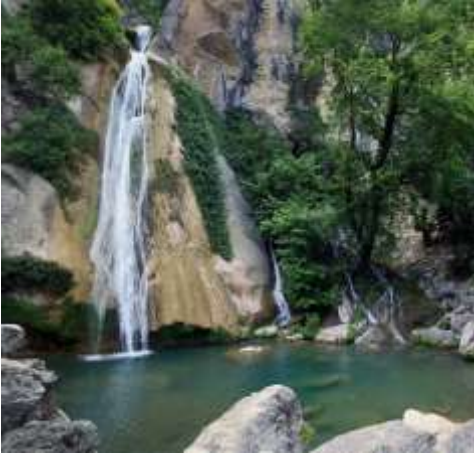
Fotoğraf 9: Antalya Etlar Köyünde Bir Su Kaynağı, Foto: Süleyman Alkan

Buna karşılık Orman Genel Müdürlüğü'ne bağlı Orman İşletme Müdürlükleri ormanları yönetir. Yönetmek için planlar hazırlar ve uygular. Böcekten, yangından, hırsızdan korumaya çalışır ormanları. Bugün Istranca dağlarındaki pek çok ormanın ana yönetim amacı sudur! Bu ormanların bakım ve korunması için gerekli parayı; ana gelir kalemi odun hammadde satışları olan döner sermaye bütçesi ile Maliye Bakanlığı'nın vatandaşların vergilerinden ayırdığı genel bütçeden sağlar.