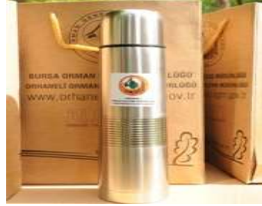
Fotoğraf 8: Kendi küçük etkisi büyük yangıncı termos

Yangın ve çobanı birlikte düşündüğümüzde, bu demektir ki çoban ateşinin ihmali, her yıl ortalama 2,2 yangına neden olmuş. 1,986 hektar orman, her yıl çoban ateşiyle harap olmuş!