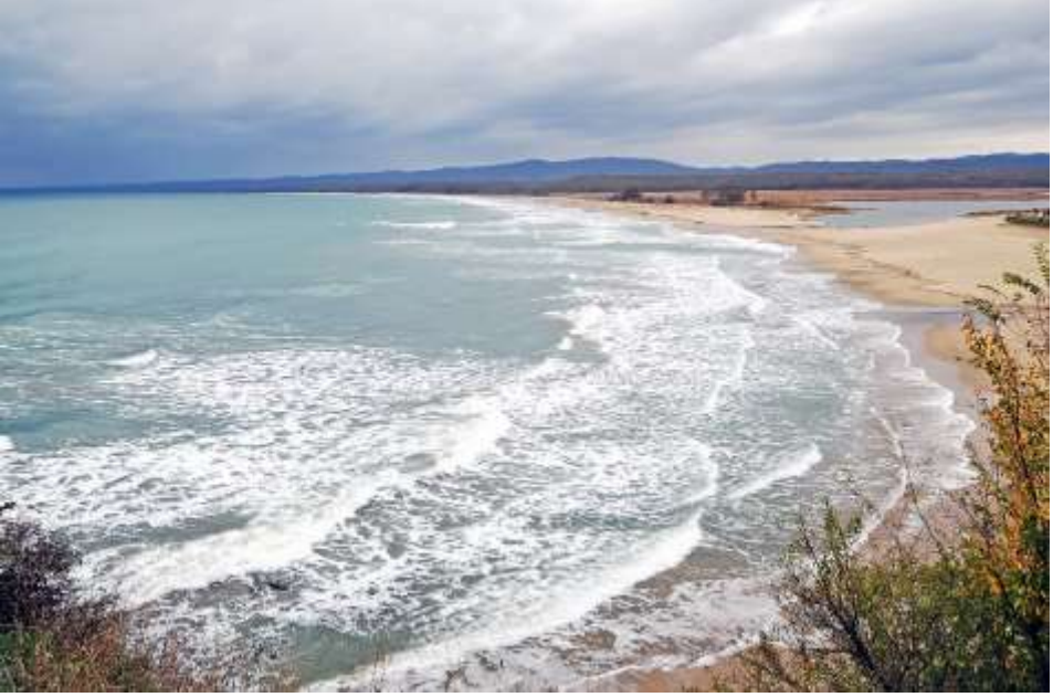
Fotoğraf 14: Mert Gölü ve Karadeniz Ekosistemlerinin Birleştiği Yer, Arada Kumul, Arkada ise Orman Ekosistemleri

Günümüz dünyasında Longoz ormanlarının görülebileceği birkaç yerden biridir İğneada! Fakat su seviyesindeki değişim sadece ormanları değiştirmekle kalmaz! Gölleri de değiştirir. Sular yükselince göl bildiğimiz Mert'i, Saka'yı, Erikli'yi Karadeniz'den ayıran kumul bandını PATLATIR ve tatlı sularla tuzlu suyu, göl ekosistemi ile deniz ekosistemini buluşturur. Bu patlama, aslında ayrı bir ekosistem olan kumullarda da değişimlere neden olur. O nedenle İğneada çevresi orman, göl, sulak alan, kumul ve deniz ekosistemlerinin iç içe geçtiği çok ender bir ekosistemler birliğidir. Ekosistemler çeşitliliği beraberinde tür çeşitliliğini de getirir.