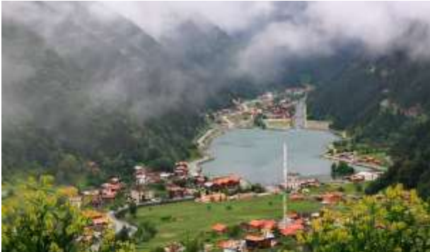
Fotoğraf 2: Trabzon Uzungöl'de Yasalar Eliyle Yapılaşmanın Rolü Nedir?

Ama bu iki durumda da, bırakınız devlete para kazandırmayı, kamu bütçesinden harcama yapmak gereklidir. Bütçe harcanır fakat devlet kurumlarına güven harcanmaz! Devlet para kaybedebilir fakat yasa içerisinde kaldığı halde kaybeden haline getirilen vatandaşın güveni kazanılır. Bütün birikimini bir ev arsasına bağlamış vatandaşın tüm ömrü, birikimi yok edilmemiş olur.