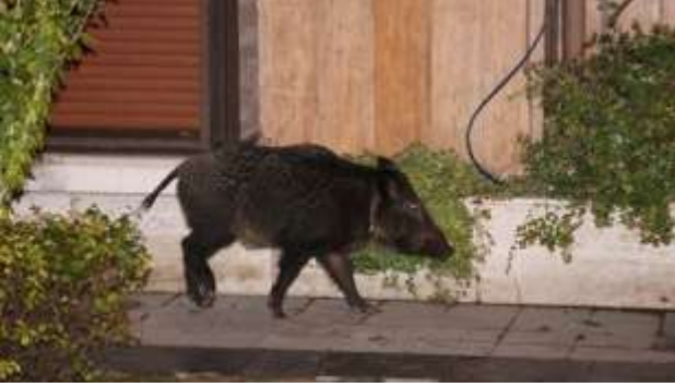
Fotoğraf 12: İstanbul Bebek Sokaklarında Gezinen Bir Domuz

Görgü tanıklarına göre Asya yakasından, Avrupa’ya geçmiş domuzlar. Habercilerin konuştuğu yaşlıca tanıklar, hiç böyle bir olaya şahit olmadıklarını, zaman zaman orman tarafından domuz indiğini, ama denizden çıkarma yapanını hiç görmediklerini söylüyorlardı!