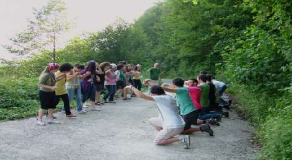
Fotoğraf 17: Kültüre kayıtsız kalmayan ekoturistler, bir doğa etkinliğinde horon öğreniyor, Foto: Oğuz Kurdoğlu

En güzel yerde dur , önerisinde sorun yok! Ama oranın güzelliğini değiştirmeyecek zamanda ve şekilde durmak gerekir! Bir de çadır kur , önerisine de izin verilebilir. Hatta renkli olmasına bile göz yumulabilir. Fakat yine yer, zaman ve biçim önemli! Sadece kamp yapılabilecek yerlerde bunu yapmalısınız. Bu hem doğa hem sizin güvenliğiniz için gereklidir. Kazdağları'nda dere yatağına kamp kuran ailenin gece gelen selle kaybedilen fertlerinin acısını hatırlayınız. Her yer kamp yeri değildir. Kamp demişken, yeni şarkımızdaki kamp ateşini harla sözlerini, hayatımızdan çıkarsak daha iyi olmaz mı? Pikniklerimizi hatırlayın. Zaten ya kibrit unutulur, ya tuz eksiktir ya da ateşi doğru düzgün yakamayan eşimiz dostumuz sayesinde, pişmemiş ya da kömürleşmiş etleri yemek zorunda kalırız! Bütün bunlar için ormanı yakma riskini artırmaya değer mi? Etleri mideye yuvarlamaktan çok; bilgiyi beyne, duyguyu kalbe götürmeyi hedefleyelim. En iyisi içimizdeki keşif ateşini güçlendirmek! Lütfen yukarıdaki şarkının ilgili satırlarını bu içerikte değiştirin.