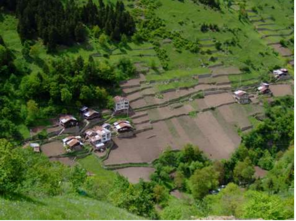
Fotoğraf 15: Trabzon Çaykara'nın Eğimli Arazisinde Bitki Örtüsü Değişiyor, Ya Toprak ve Su Dengesi?

faturayı keser, maliyeti ödetir! Yağmur aynı miktarda yağsa bile, sel dikkate alınmadan bitki örtüsü değiştirildiğinde tehlike büyür!